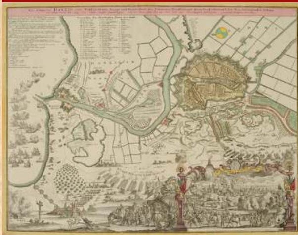
Plan oblężenia i widok ostrzeliwanego Gdańska, Polska, autor nieznan, spadkobiercy Homanna, ok. 1739 r. ; Muzeum Historyczne Miasta Gdańska

11 maja 1734 roku na gdańskiej redzie pojawiły się okręty francuskie z dwoma pułkami piechoty. Francuzi wylądowali na Westerplatte, nieopodal Twierdzy Wisłoujście. Jednak zapoznawszy się z sytuacją, nie informując dowództwa Gdańska, w nocy z 14 na 15 maja wycofali się na okręty i odpłynęli.