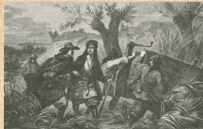
Ucieczka Stanisława Leszczyńskiego z Gdańska do Kwidzyna, z: 6 Blätter zur Geschichte von Polen, w: Historisch-genealogischer Kalender auf das Jahr 1797, Daniel Chodowiecki, Muzeum Narodowe w Poznaniu

W yjatkowo niekorzystne położenie miasta i możliwość dostania się do niewoli króla Stanisława Leszczyńskiego ułatwiła decyzję władcy. Aby uchronić się przed takim losem i ułatwić kapitulację bombardowanego Gdańska, potajemnie, w przebraniu wieśniaka, opuścił miasto w nocy z 27 na 28 czerwca. Przedostał się do Kwidzyna, a stamtąd do Królewca. Gdańsk poddał się 7 lipca 1734 roku.