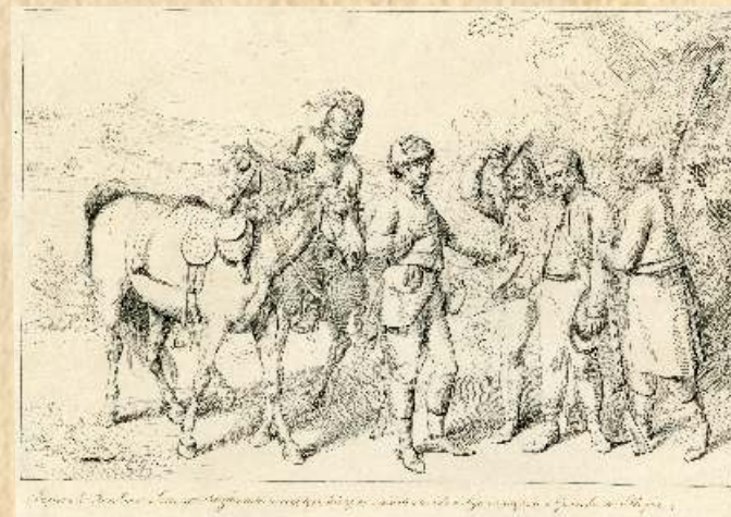
Przygoda Stanisława Leszczyńskiego w drodze z Gdańska do Kwidzyna, Józef Peszka (1767-1831), Zakład Narodowy im. Ossolińskich

W yjatkowo niekorzystne położenie miasta i możliwość dostania się do niewoli króla Stanisława Leszczyńskiego ułatwiła decyzję władcy. Aby uchronić się przed takim losem i ułatwić kapitulację bombardowanego Gdańska, potajemnie, w przebraniu wieśniaka, opuścił miasto w nocy z 27 na 28 czerwca. Przedostał się do Kwidzyna, a stamtąd do Królewca. Gdańsk poddał się 7 lipca 1734 roku.